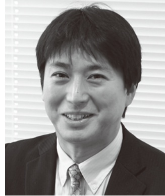
大阪大学医学系研究科特任教授、 日本再生医療学会 常務理事

京都大学医学部卒。同大学大学院医学研究科博士課程修了。医学博士。米ソーク研究所博士研究員、京都大学医学研究科脳神経外科講師、同大学再生医学研究所(現医生物学研究所)生体修復応用分野准教授などを経て、2022年より現職。神経難病に対するiPS細胞を用いた細胞移植治療の開発に力を注いでおり、パーキンソン病に対する医師主導治験を行っている。