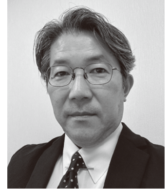
大阪大学大学院医学系研究科・医学部付属病院 産学連携・クロスイノベーションイニシアティブ 特任准教授

佐賀医科大学医学部卒。2010年大阪大学大学院医学系研究科博士課程修了。11年同大学大学院医学系研究科助教、12年厚生労働省医政局研究開発振興課課長補佐(高度医療専門官併任)、19年同大学医学部付属病院未来医療開発部再生医療等支援室副室長などを務め、23年同大学大学院医学系研究科産学連携・クロスイノベーションイニシアティブ特任教授に着任、現在に至る。